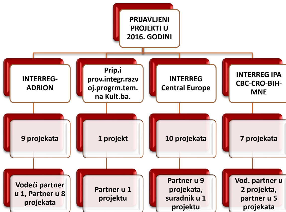
Slika 3: Shematski prikaz prijavljenih projekata po programima u 2016. godini

U nastavku navodimo projekte koje je pripremala Agencija za razvoj Zadarske županije ZADRA NOVA te prijavila u 2016. godini. Njihovo ocjenjivanje se očekuje u 2017. godini. Provedba projekata koji budu pozitivno ocijenjeni započeti će u 2017. godini.