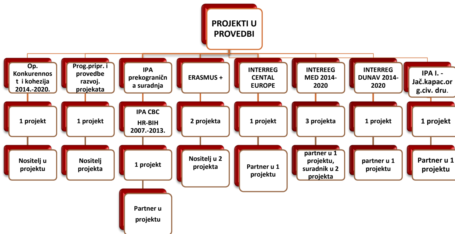
Slika 2: Shematski prikaz projekata u provedbi po programima

Tijekom 2017. godine Agencija za razvoj Zadarske županije provoditi će projekte koji su odobreni i ugovoreni u prethodnom razdoblju, te projekte i programe koji se planiraju započeti provoditi u 2017. godini. Agencija za razvoj Zadarske županije ZADRA NOVA je pripremala ili sudjelovala u njihovoj pripremi.